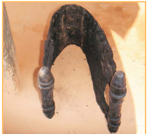
राडी बुन्दा कम्मरमा लगाउने छालाको पेटी