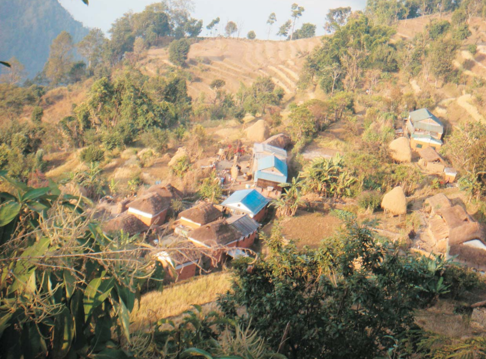
नेटा गा. वि.स.को वरदानी गाउँ