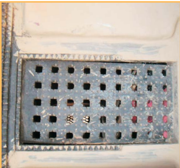
कलात्मक आँखी भ्याल