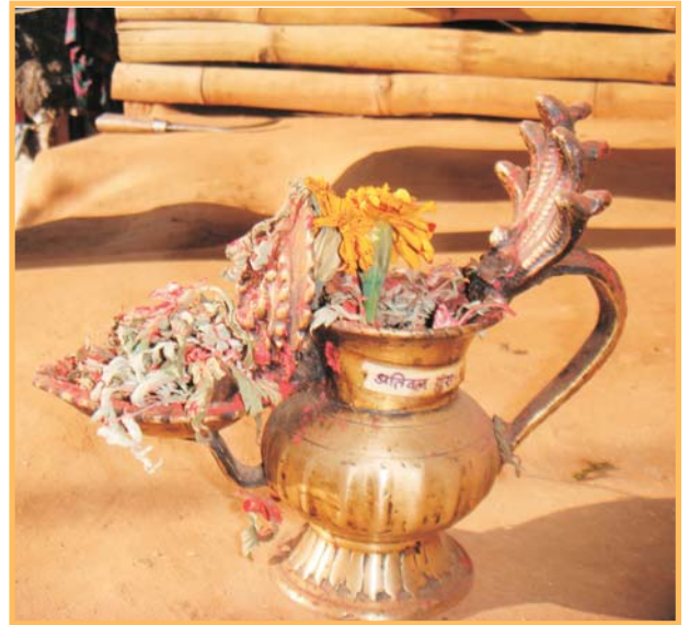
पाँचमुखे नाग भएको पूजाको भाँडो