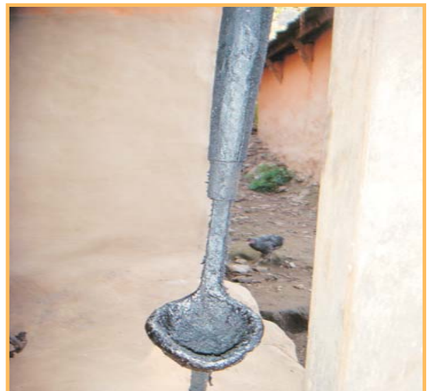
दियो बाल्ने ठडालु