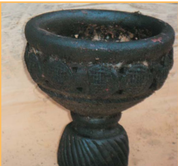
धुप बाल्ने भाँडो