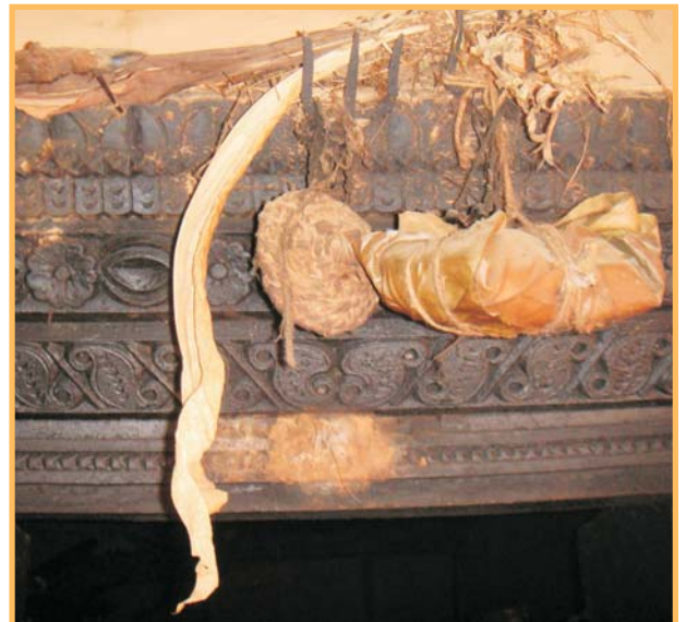
कलात्मक ढोकाको चौकोस