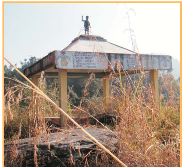
ऐतिहासिक सिन्दुरे ढुङ्गा