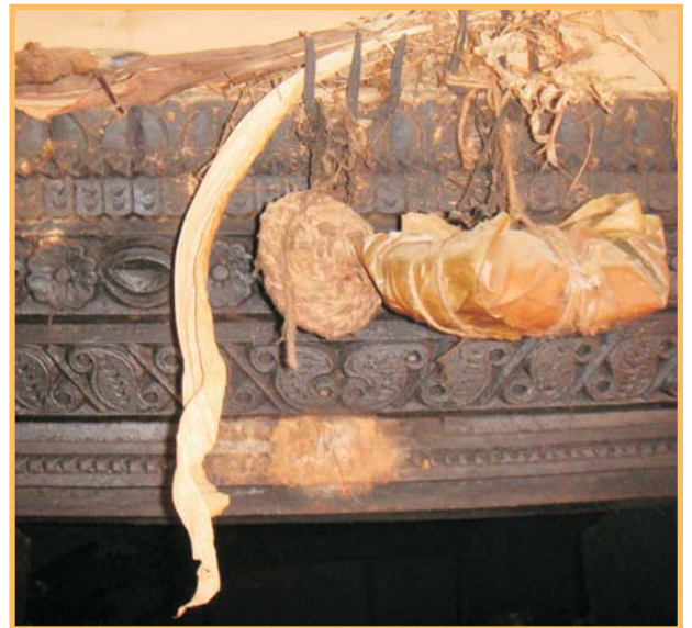
कलात्मक ढोकाको चौकोस