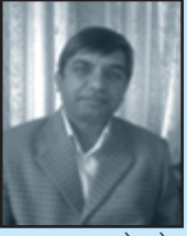
कमलप्रसाद पोखरेल उपसचिव, सर्वोच्च अदालत